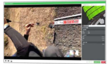
クラウドを活用した建設DX